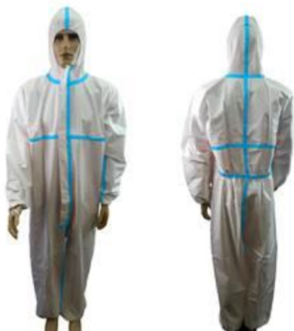
CA 42 904

Ref.: LJ 80- Macacão impermeável com capuz e fitas termoselada na costura - similar ao 1" tyvec " da DuPont Gramatura 45-50, impermeável, alta respirabilidade(maior conforto ao uso),alto conforto, barreira á vírus Tamanhos: p/m/g/gg/exg/exxg