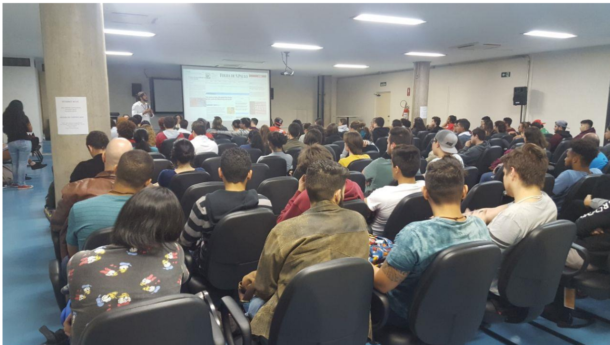
Imagem 5: Audiência Campus São José dos Campos realizada em 10/08/2017