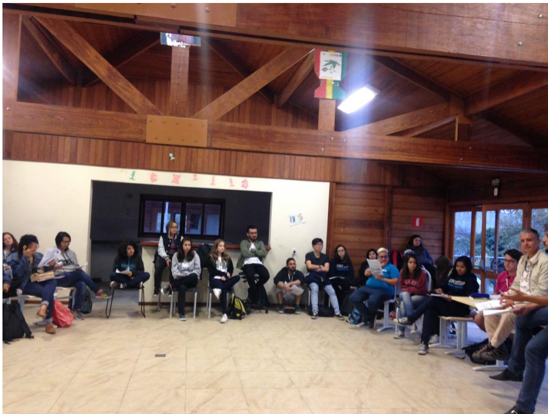
Imagem 3: Audiência Campus Guarulhos realizada em 15/08/2017