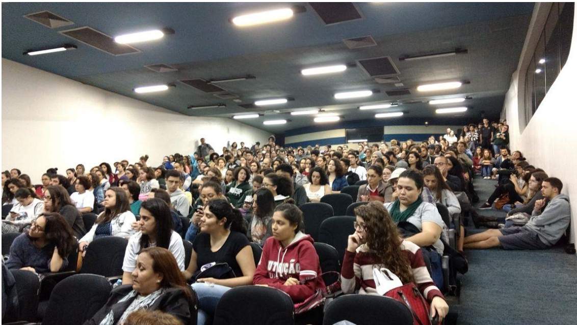
Imagem 1: Audiência Campus Baixada Santista realizada em 17/08/2017

Essas ações serão fundamentais para a luta e manutenção das ações de permanência estudantil de 2018. Contamos com todos(as).