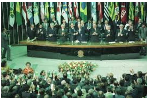
Promulgação da Constituição brasileira, em Brasília, no Distrito Federal, em 1988.

BRASIL. Constituição da República Federativa do Brasil de 1988. Disponível em: < www.planalto.gov.br/ccivil_03/Constituicao.htm >. Acesso em 30 nov. 2017.