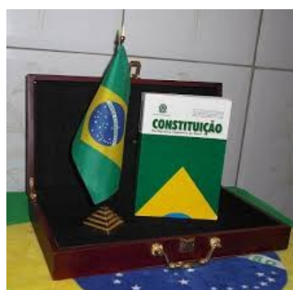
Capa da Constituição de 1988.

1) O que você sabe sobre a Constituição Brasileira?