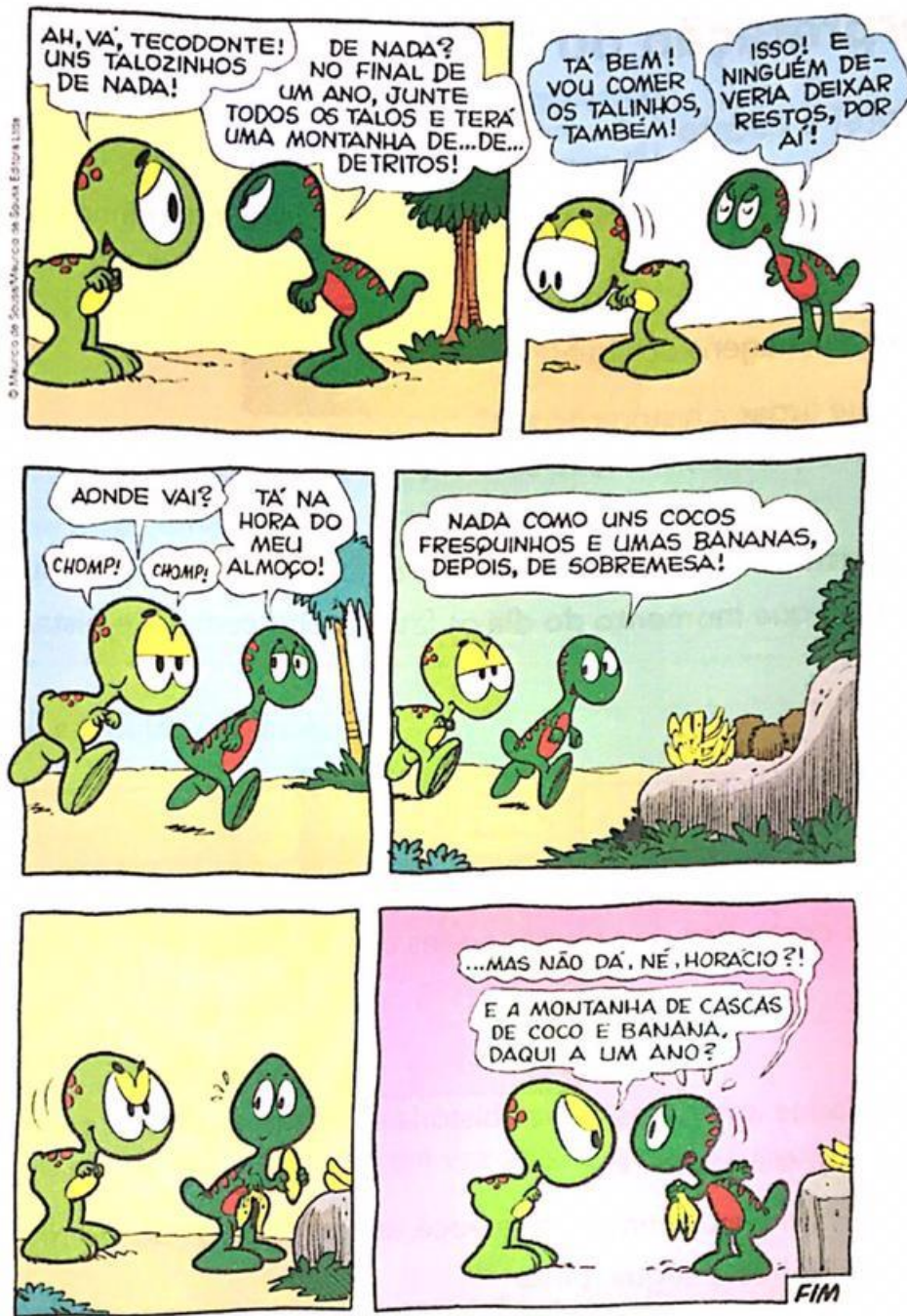
Maurício de Sousa. Piteco & Horácio . n. 9. Barueri-SP: Panini Comics, mar. 2013. p. 26-27.