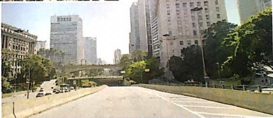
➤ Vale do Anhangabaú com o viaduto do Chá ao fundo. Foto de 2017.