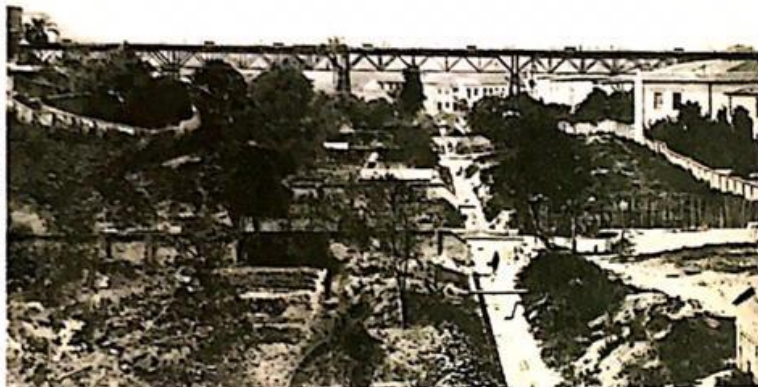
➤ Vale do Anhangabaú. Ao centro, o rio Anhangabaú; sobre o rio, vê-se o viaduto do Chá. Foto de 1905.