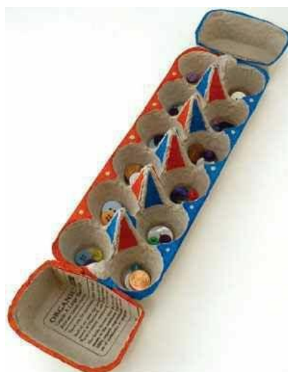
Caixa de ovo