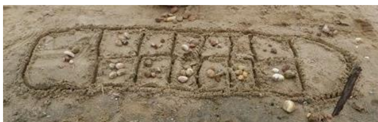
Na terra ou areia

Lembre-se que quem quiser poderá publicar as fotos das atividades, direto na nossa pagina.