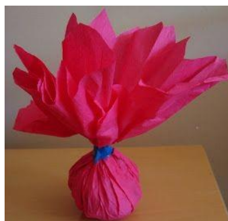
PETECA DE PAPEL COLORIDO