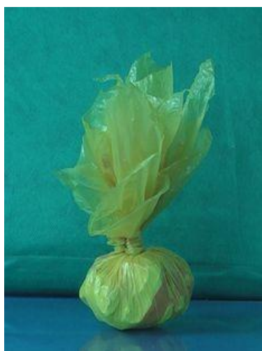
PETECA DE SACO PLÁSTICO

O recheio pode ser qualquer papel firme que deixe a parte onde vocês irão bater na peteca bem duro; e para não desmontar na hora da brincadeira ela precisa estar bem amarrada.