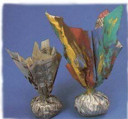
PETECA DE JORNAL

Para começar vamos escolher um desses modelos ou inventar outra forma de construir sua peteca e começar a brincadeira.