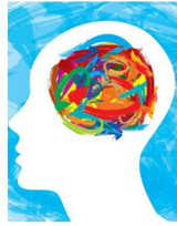
Urgência em saúde mental