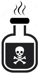
Intoxicação ou acidente com produtos perigosos